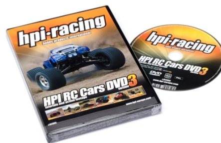
H92051 HPI RC Cars DVD Version 3 in Plastik Box