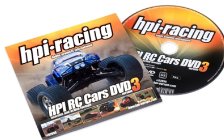
H92050 HPI RC Cars DVD Version 3 in Papphülle

Die DVD mit der Bestellnummer H92050 wird in einer formschönen Papphülle geliefert. Die HPI RC Cars DVD Version 3 mit der Bestellnummer H92051 ist inhaltlich identisch, wird jedoch in einer praktischen und hochwertigen Plastikbox ausgeliefert!